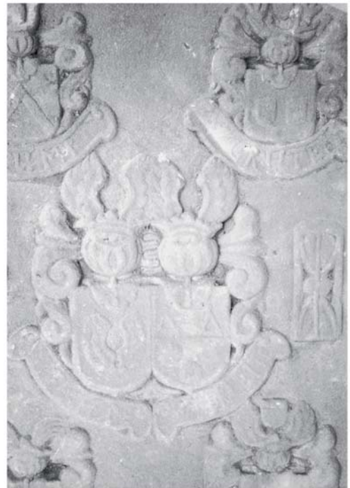
→ Zentrales Detail der Grabplatte der E. v. Vittinghof