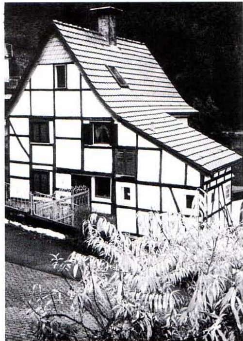
Das alte Fachwerkhaus Loloeh Nr. 7 von Ernst Stuckmann sen.

Besonders schön zeigt sich der rechte traufseitige Anbau mit Pult- bzw. Schleppehdach am Stuckmann-Haus Nr. 7, wo ein Stall und ein kleiner Heuboden erkennbar bleiben.