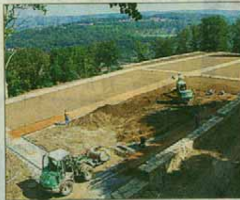
Die Arbeiten laufen im Schlossgarten der Schlossterrassen auf Hochtouren.

Julia Dettmann ist guter Dinge, dass der sanierte Wehrgang Ende September