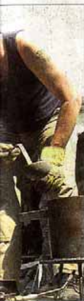
... in alter Zeit: ... stian Heinemann ... historischen Ge- ...

Plattgeschmiedete Rundstäbe dienen als Geländerbänder und werden in die Ösen der Pfosten geführt und dort später mit Stopfblei befestigt. „Ist das Geländer rund um den Wehrgang aufgestellt, wird es noch mit einer speziellen Eisen-Glimmerfarb gestrichen“, so Michael Rabe, der im Rahmen der Restaurierungsarbeiten auch das Dachgeschoss des ehemaligen Schlosspalais ausbauen ließ - im Auftrag des Förderkreises Deutsches Kaltwalzmuseum, der im Schloss seit