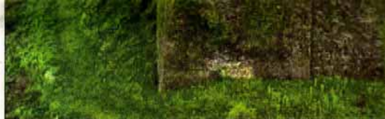
Auch aus der Luft ein faszinierendes Bild: Schloss Hohenlimburg wird derzeit für den Besucher erhalten.

Jahrhunderte erhalten gebliebene Höhenburg Westfalens schon von weitem auszumachen. Die Kettensägen der fürstlichen Waldarbeiter haben ganze Arbeit geleistet. Der „Kahlschlag“ soll allen Besuchern einen atemberaubenden Blick über das Lennetal öffnen. Schloss Hohenlimburg wird herausgeputzt!