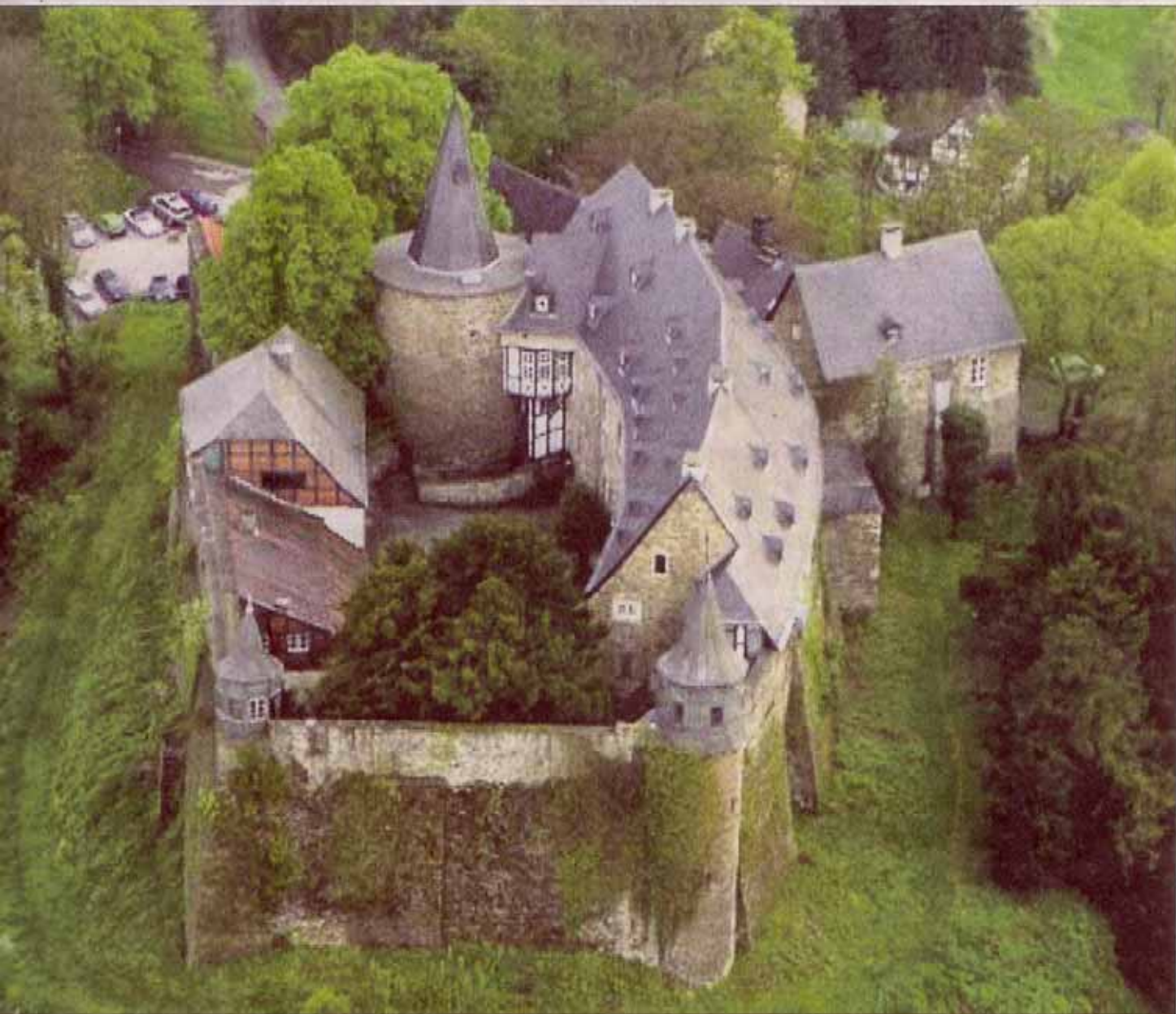
Der Luft ein faszinierendes Bild: Schloss Hohenlimburg wird derzeit für Besucher herausgeputzt. Wichtig ist dabei, den historischen Charakter zu