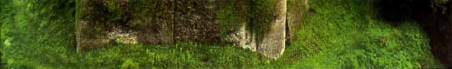
aus der Luft ein faszinierendes Bild: Schloss Hohenlimburg wird derzeit für Besucher herausgeputzt. Wichtig ist dabei, den historischen Charakter zu erhalten.